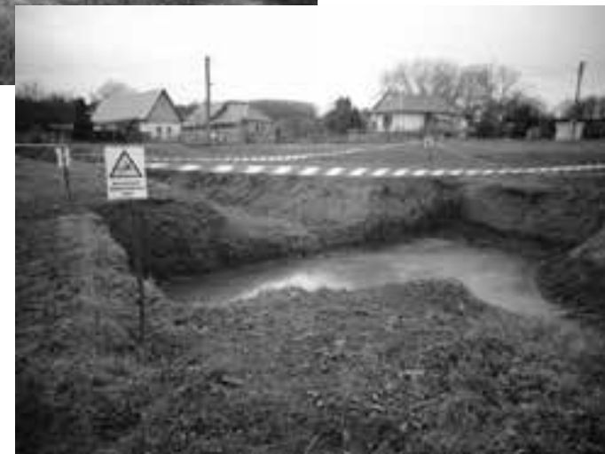
Odvodňovací kanál – prepadová jama