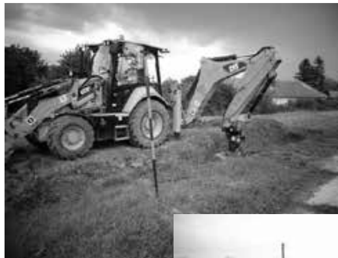
Prehľbovanie odvodňovacieho kanála