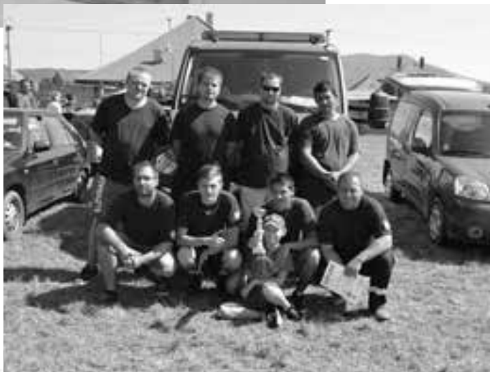
DHZ Malé Zálužie na súťaži